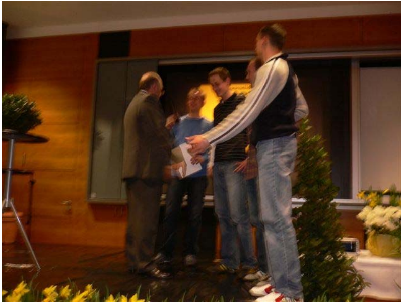
4x100 m Staffel 7. Platz; Mannschaften für den 3. Platz bei den Süddt. Juniorenmeisterschaften