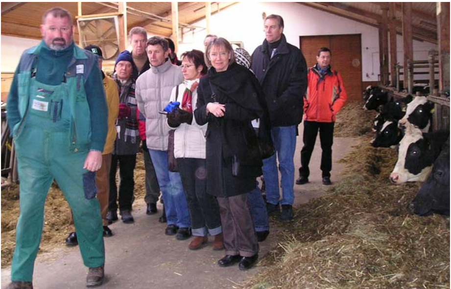
Die Gruppe im Stall

Die Biogaserzeugung ist in weitem Umkreis die einzige Anlage dieser Art, wobei allein an Investitionen für die Stromerzeugung 800 000,- erforderlich waren.